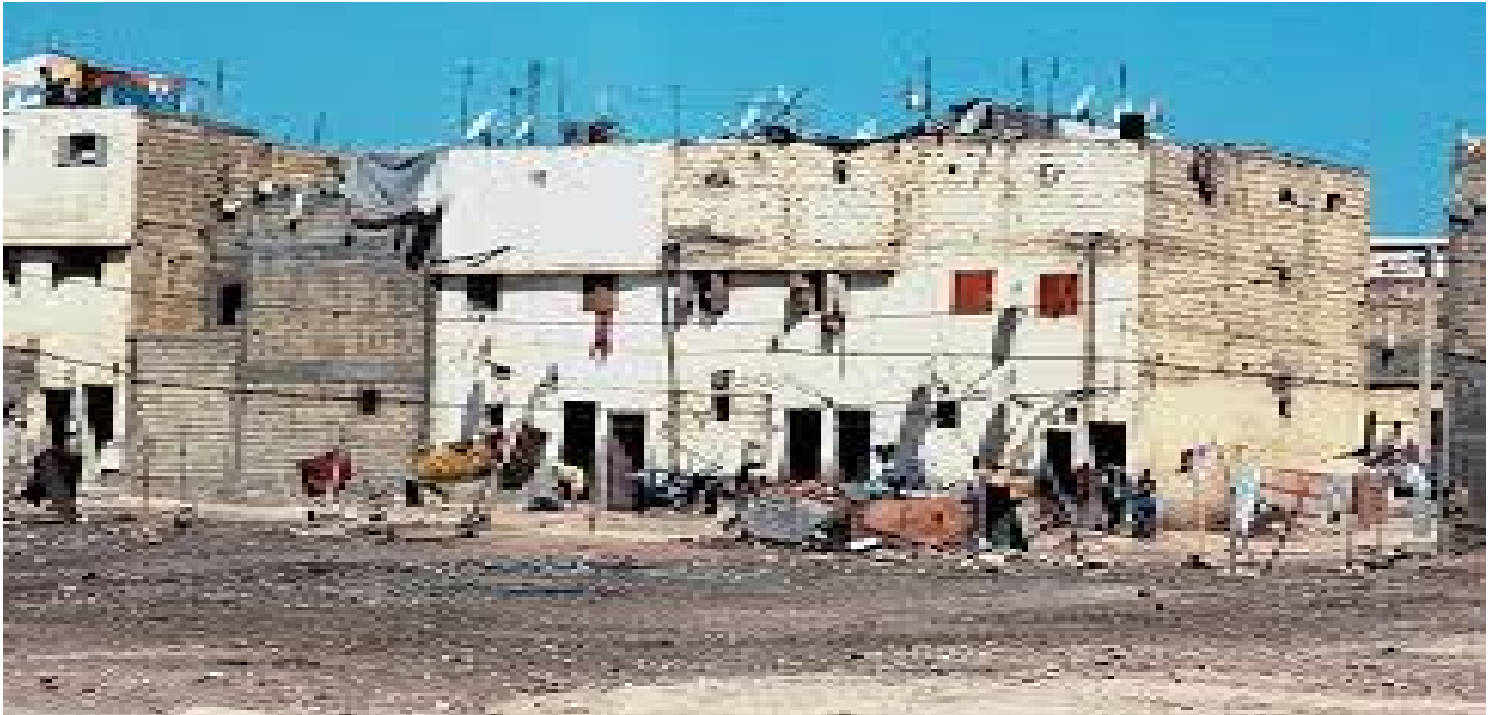
Quartier non réglementaire